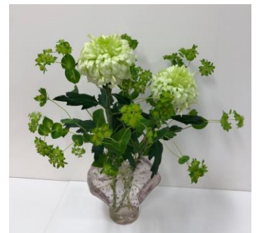
菊・ププレリウム