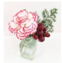
カーネーション ヒペリカム・もみの木