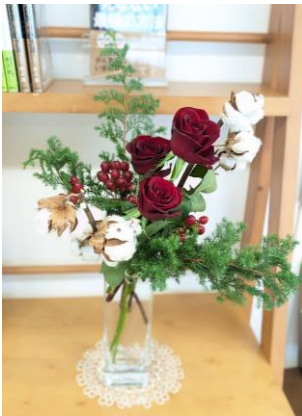
薔薇・綿 ヒペリカム・もみの木