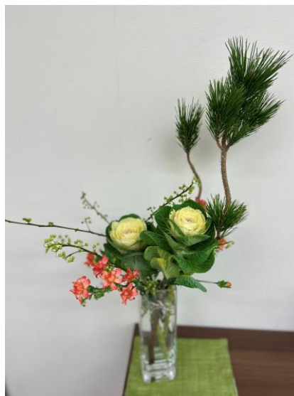
松・カーネーション 葉ボタン・青文字