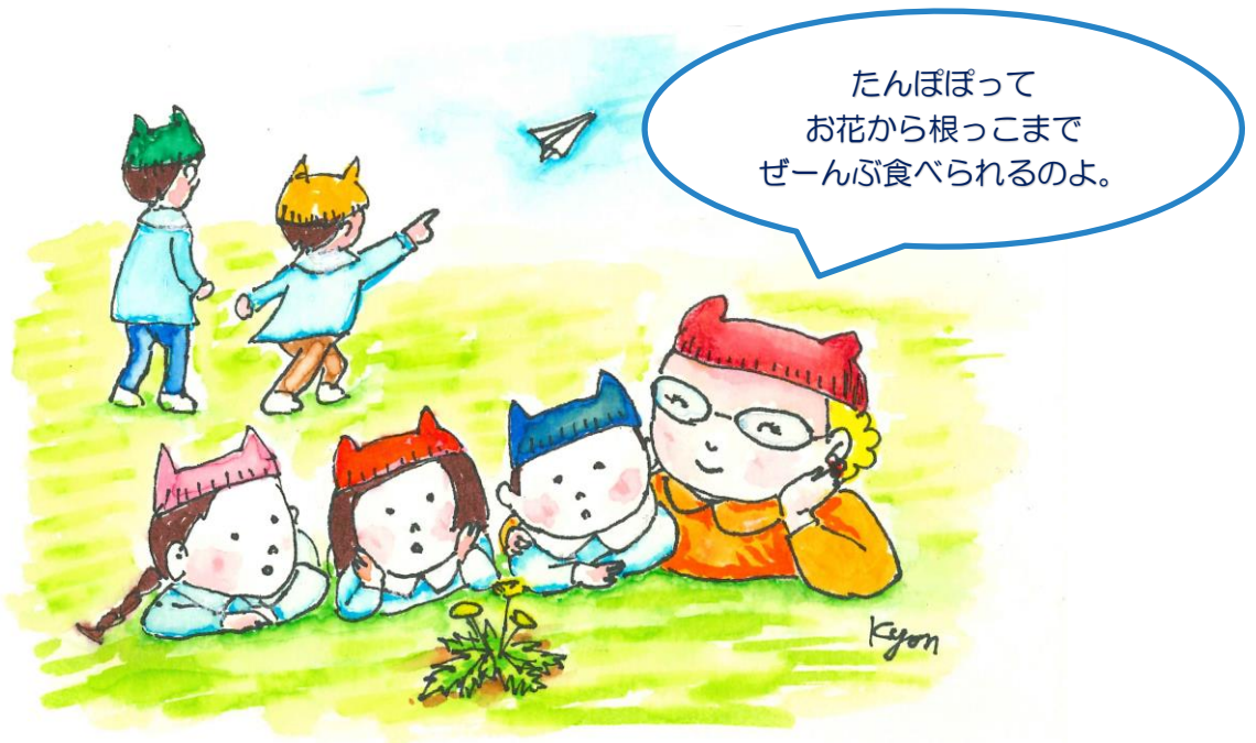
猫耳保育園 みみ子先生と子どもたち