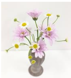
菊・マトリカリア

春ですね。クリニックのお花たちも待っていました！ とばかりに咲き誇っています。この時季の好きなお花の ひとつにフリージアがあります。お花の姿はクールな感 じですが、何とも言えない甘いフルーティな香りがしま す。その香りは高ぶった神経を落ち着かせる効果がある そうです。