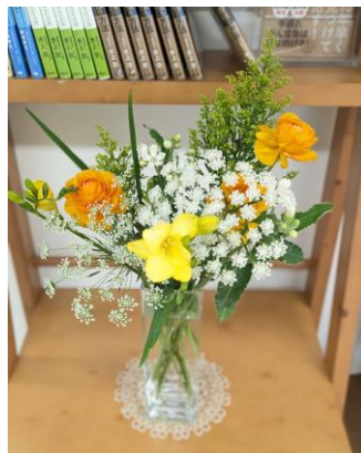
ランキュラス・ソリダゴ・ フリージア・レースフラワー ・ホワイトスター