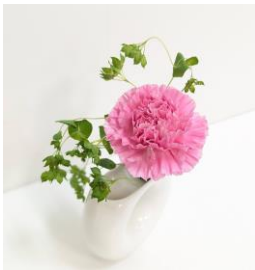
カーネーション ・プブレイウム