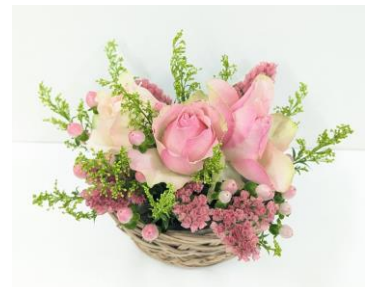
薔薇・スターチス・ ヒペリカム・ソリタゴ